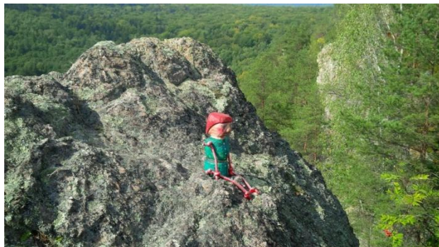
Škriatok Mikluš na vrchole Miklušovských skál.

Škriatok dal Zuzke zázračný šíp a povedal, čo má s ním robiť (pozn.znenie tohto zastavenia som nezachytil).